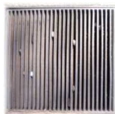
Sifoni, tombini e grate di scolo