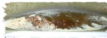
Bidoni, secchi, teloni